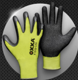
X-GRIP-LITE 51-025 Art. nr. 1.51.025.00