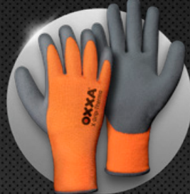
X-GRIP-THERMO 51-850 Art. nr. 1.51.850.00