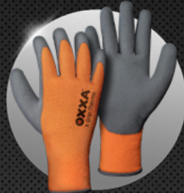
X-GRIP-THERMO 51-850 Art. nr. 1.51.850.00