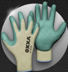
X-GRIP 51-000 Art. nr. 1.51.000.00