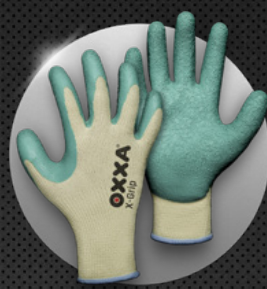
OXXA X-GRIP 51-000 Art. nr. 1.51.000.00