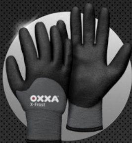
OXXA X-FROST 51-860 Art. nr. 1.51.860.00