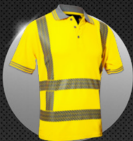
X-VIZ-COMFORT 6210 RWS Art. nr. 2.76.210.00