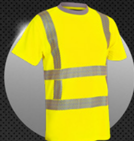
X-VIZ-FLEX 6200 RWS Art. nr. 2.76.200.00