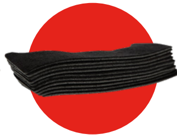
KIGALI 8205 Art. nr. 6.78.205.00